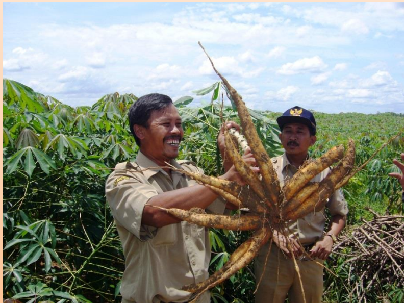
キャッサバ高収量栽培プロジェクト(インドネシア)