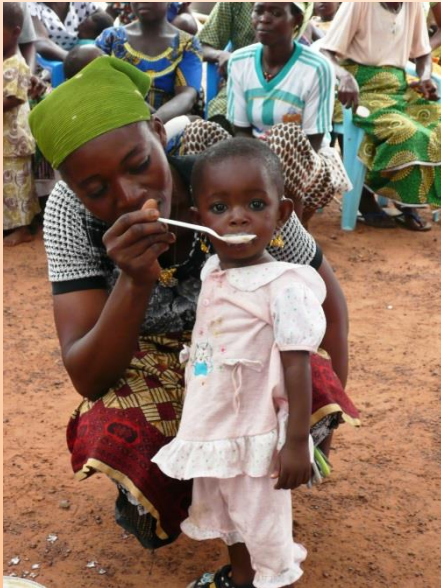
栄養サプリメントの試食会(ガーナ)