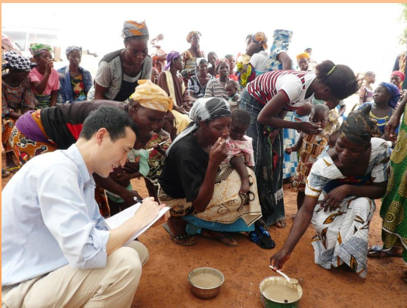
USAID-JICA-味の素連携による栄養改善プロジェクト(ガーナ) ガーナの伝統的離乳食に添加する栄養サプリ